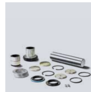
Kit riparazione fuselli