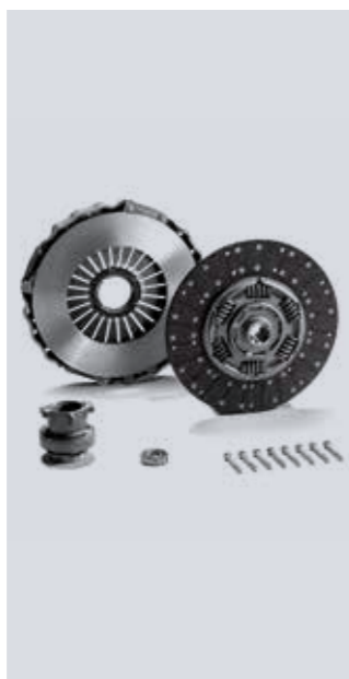
Kit frizione ecoline

Include disco frizione, spingidisco, cuscinetto di rilascio, cuscinetto pilota e i bulloni necessari.