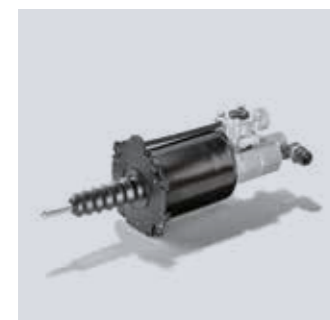
Intensificatore disinnesto frizione