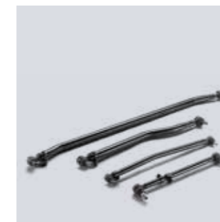
Barra di accoppiamento