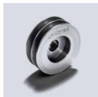
Puleggia a gola