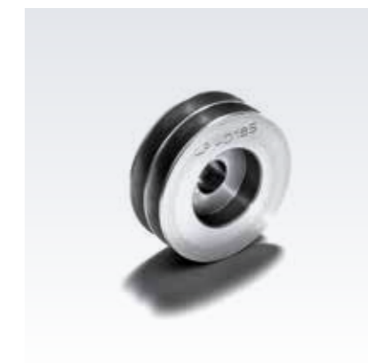
Puleggia a gola