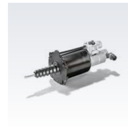
Intensificatore pressione disinnesto frizione